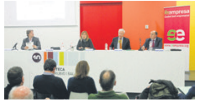
La Biblioteca Jordi Rubió i Balaguer va acollir la presentació de la Reempresa a Sant Boi. Assesora als empresaris que volen vendre la seva empresa com a les persones reemprenedores disposades a donar-los-hi continuïtat.