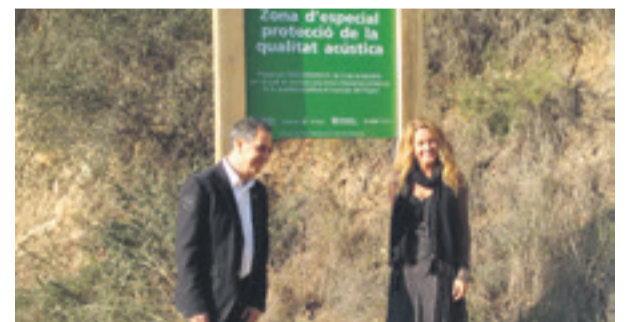
El Departament de Territori i Sostenibilitat de la Generalitat ha declarat un espai de 70 hectàrees situat al Papiol, la primera zona anomenada ZEPQA (Zona d'Espcial Protecció de la Qualitat Acústica) del país.