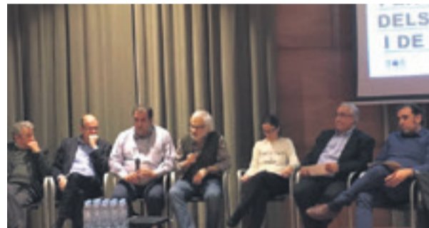
La Taula Castelldefels, plataforma formada per entitats esportives del Baix Llobregat, va celebrar un acte al Citalab de Cornellà de suport al 'Manifest per a la supervivència dels clubs esportius i de l'esport base'.