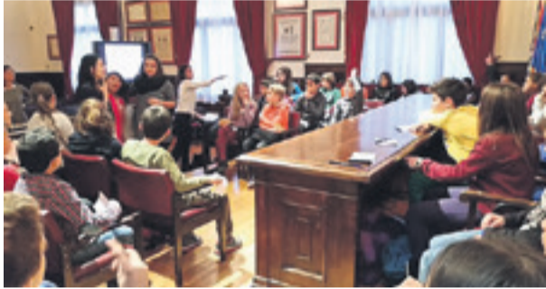
El Consell d'Infants del curs escolar 2015-2016 d'Esplugues ja està treballant en el disseny d'un nou jardí d'infants. Una trentena de nens van participar en el primer acte que va tenir lloc al Saló de Plens de l'Ajuntament.