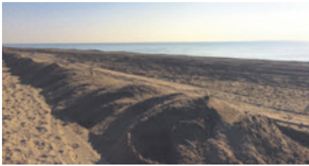
S'ha iniciat les feines de regeneració i conservació de la platja de Gavà per tal d'impulsar les accions necessàries per evitar i corregir la regressió del litoral de Gavà. L'actuació, que durarà uns 25 dies i té un cost de 60.000 euros.