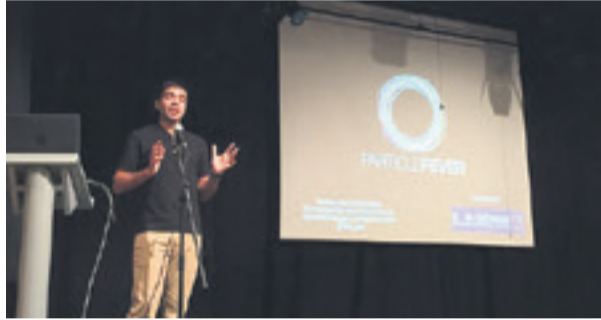
Sant Joan Despí va organitzar múltiples activitats en el marc de la Setmana de la Ciència. Sota el lema Som Ciència una bona part de les activitats se centraran en l'àmbit escolar tot i que la ciutadania també podrà participar-hi.