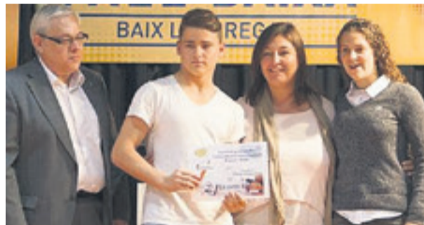
Dos-cents alumnes de secundària del Baix Llobregat van participar en les diferents activitats orientades a fomentar l'esperit emprenedor entre els joves que van tenir lloc a l'IES Bernat el Ferrer de Molins de Rei.