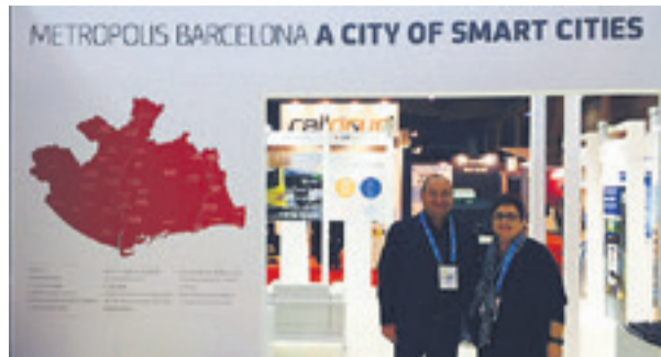
Viladecans va estar present l'Smart City Expo World Congress, el saló internacional de les ciutats intel·ligents. L'Ajuntament i l'empresa viladecanenca EGM energia van presentar les seves propostes.