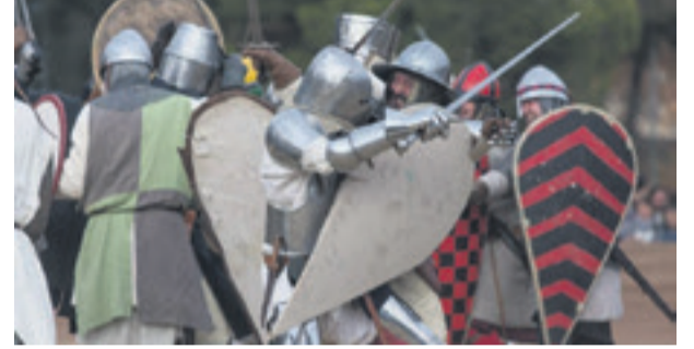
Del 5 al 8 de desembre Castelldefels va viure una nova Festa Major d'Hivern I la IV Fira Medieval Castrum Fidelis. Es van organitzar un ampli ventall d'activitats socials, culturals i esportives que van gaudir milers de persones.