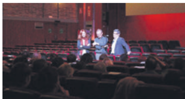
El cinema Capri del Prat va acollir preestrena del documental "El pati del darrere", dirigit per Isabel Fernández i produït per TV3. Fa una defensa i promou el coneixement del Baix Llobregat i els seus valors socials, econòmics i mediambientals.