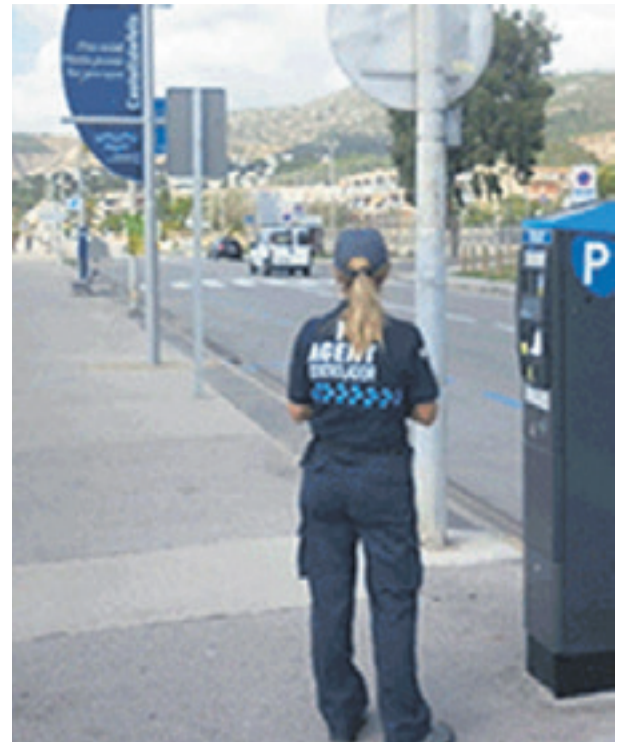
de la zona blava de la platja gestió pública del servei a cà- amb l'actual concessionària, rrec de l'empresa municipal l'equip de govern aspira a la SAC, afirma Morera.

Actualment l'empresa municipal SAC gestiona la zona blava de la resta del municipi amb uns resultats "òptims", segons el regidor d'Urbanisme, Ramon Morera. Un cop finalitzat l'actual contracte