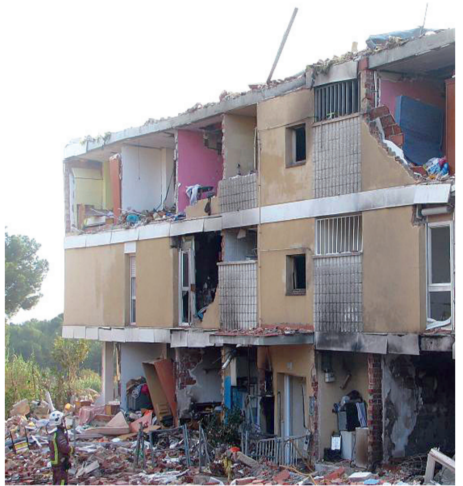
La catastrophe del passat desembre ha accelerat el procés de reforma del barri

La Policia Municipal disposarà d'una Unitat Mòbil de Prevenció i Proximitat (UMPP) que garantirà la relació diària i directa amb el veïnat i que estarà present al barri la majoria de les hores del dia. En cas necessari, la UMPP operarà en altres barris de la ciutat. Per altra banda, es preveu una presència habitual dels i les agents cíviques, per informar, ajudar, aconsellar i vetllar per a un correcte ús de la ciutat i del barri i de les relacions de convivència ciutadana. Un altre dels àmbits d'actuació en matèria de seguretat farà referència a la limitació i el control dels accessos indirectes al barri. El programa també contempla un increment de la investigació i persecució del tràfic d'estupefaents així com la creació de la Mesa Sectorial Trimestral.