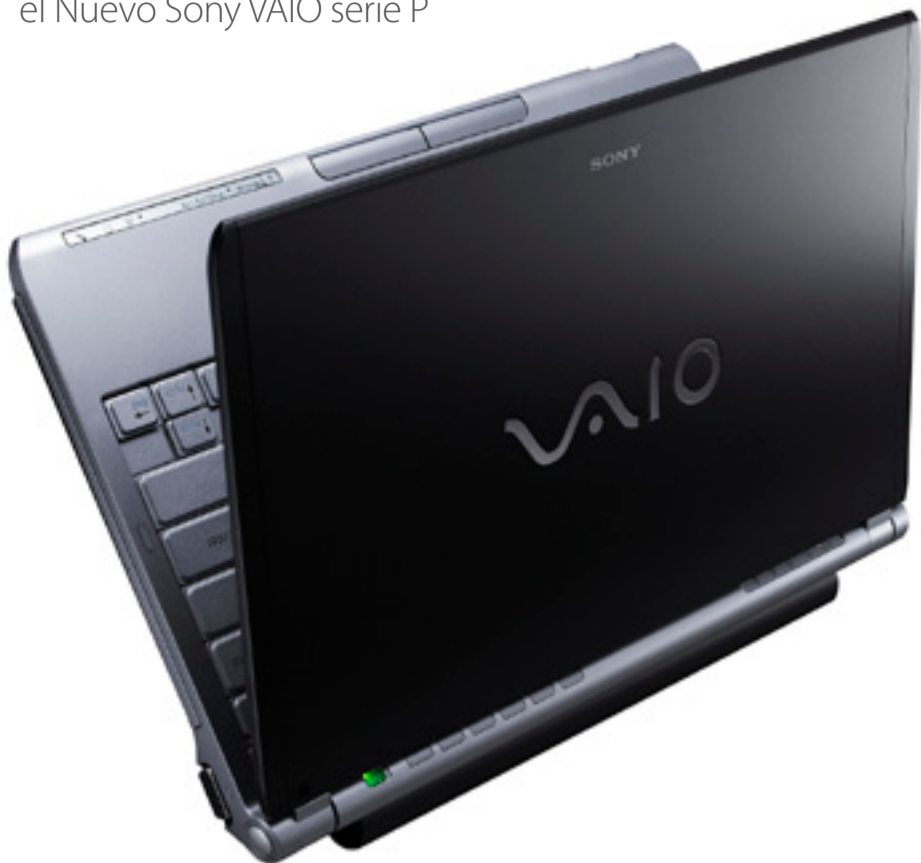
Imagen depurada, diseño sofisticado

SONY vuelve a marcar tendencias en tecnología portátil con el Nuevo Sony VAIO serie P