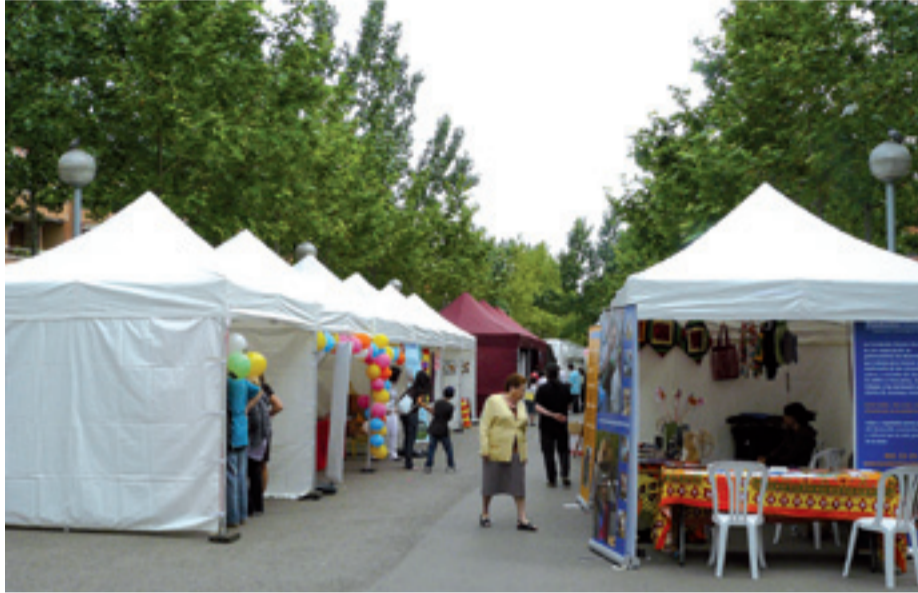
Imatge de la Festa de la Solidaritat i el Comerç Just