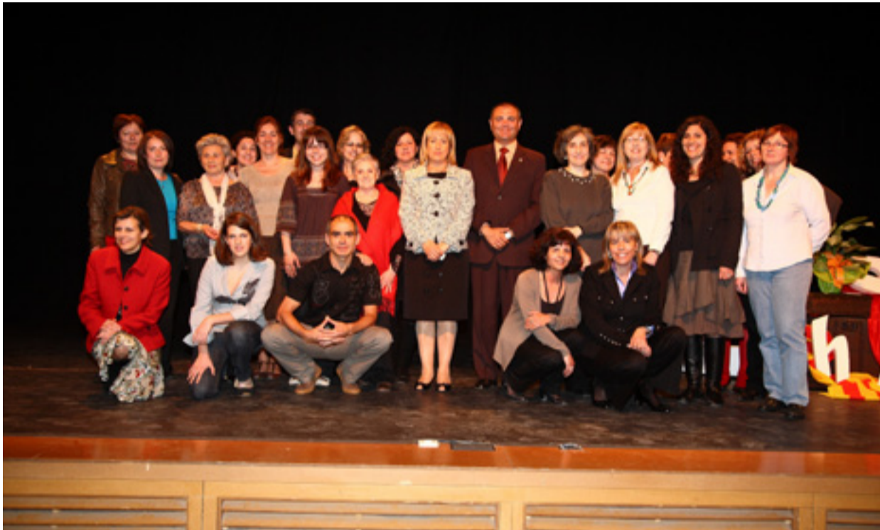
Foto de família dels guardonats

Durant l'acte, Montserrat Carulla va interpretar la seva darrera obra 'Itinerari de paraules'. Es van lliurar els Premis de Relats Breus de Sant Joan Despí, el de Dones, el de la Gent Gran i el Jove Literat.