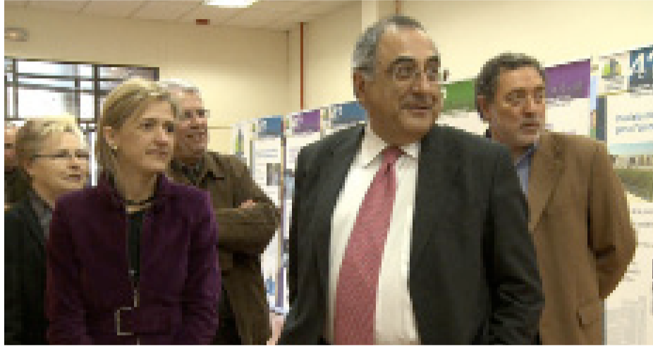
Joaquim Nadal i Pilar Díaz en un moment de la visita a Esplugues

El conseller Joaquim Nadal va signar el 27 de març els convenis de la Llei de barris d'Esplugues i Sant Joan Despí, que compten amb 14 i 10 milions d'euros, respectivament, per dur a terme tots els projectes.