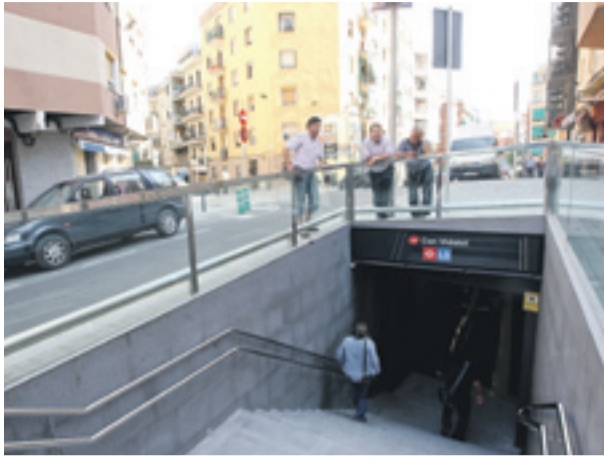
E splugues inaugura la nueva estación de la línea L5 de Can Vidalet.