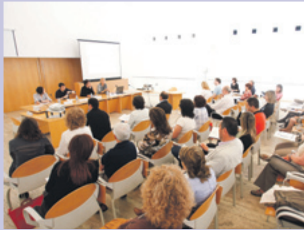
P resentación del Observatorio Comarcal del Baix Llobregat en Sant Feliu de Llobregat.