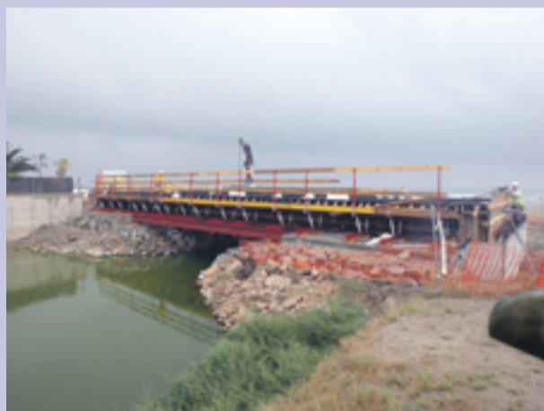
Obras de construcción del puente sobre la riera de Canyars, llevada a cabo por el ministerio de medio ambiente.