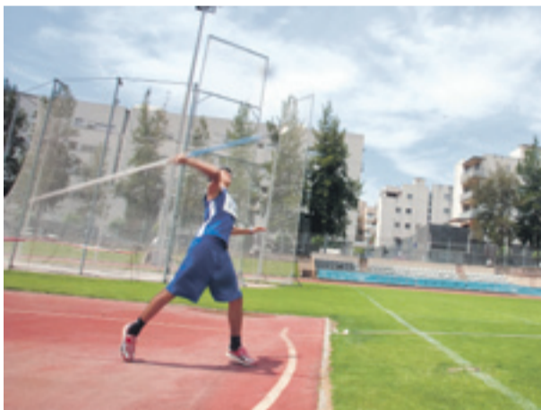
C ampeonato de Atletismo en el Estadio de la Bóbila de Gavà.