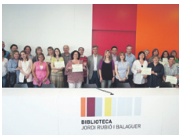
Varias Escuelas e Institutos, firman el pacto por la xarxa d'Escoles per la sostenibilitat.

Biblioteca Jordi Rubió i Balaguer - SANT BOI DE LLOBREGAT | 04-06-2010