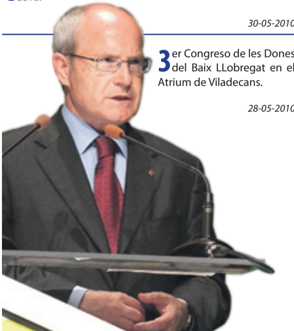
3 er Congreso de les Dones del Baix Llobregat en el Atrium de Viladecans.