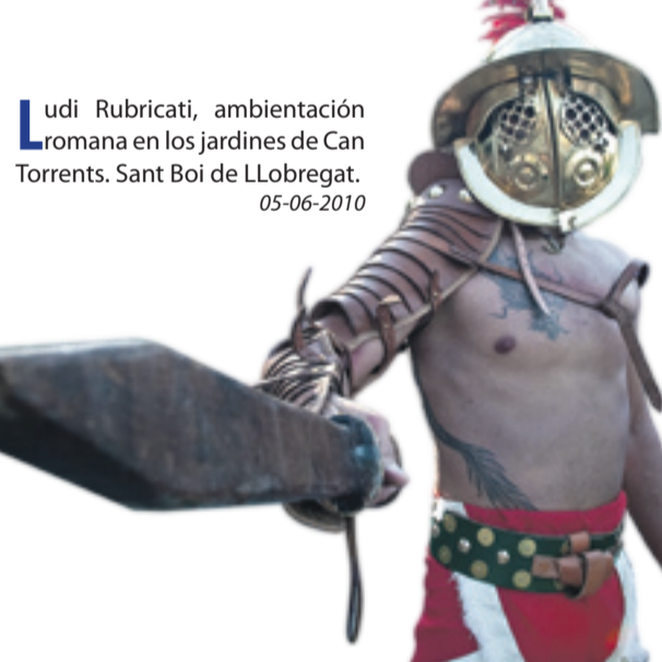
Ludi Rubricati, ambientación romana en los jardines de Can Torrents. Sant Boi de Llobregat. 05-06-2010

Todas las imágenes del Baix Llobregat las encontraras actualizadas a diario en: www.baiximagenes.es