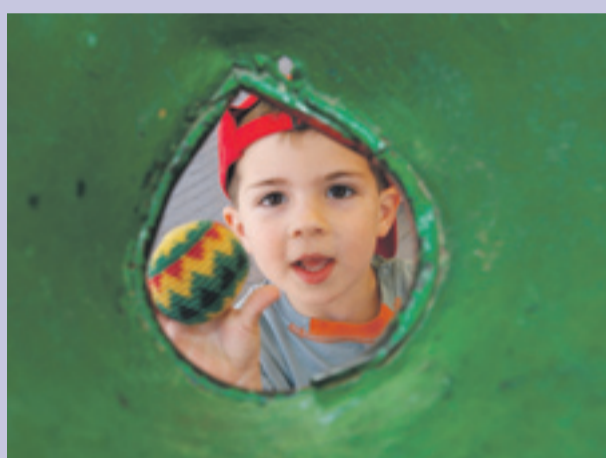
La Recicla festa en la Plaza Jaume Balmes de Gavà.

Biblioteca Jordi Rubió i Balaguer - SANT BOI DE LLOBREGAT | 04-06-2010