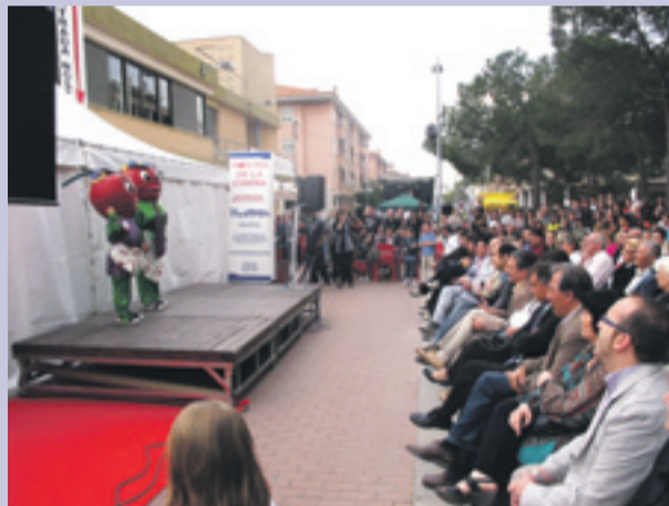
I nauguración de la XXV Festa de la Cirera de Santa Coloma de Cervelló del 28 al 30 de Mayo.