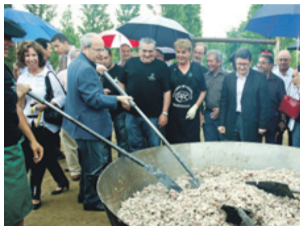
Jornadas Extremeñas con la visita de autoridades políticas en El Prat de Llobregat.