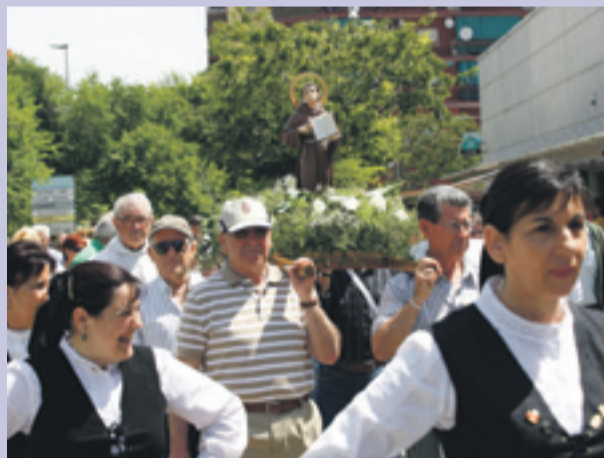
M isa y Procesión del Centro Castellano-Leones de Sant Boi.