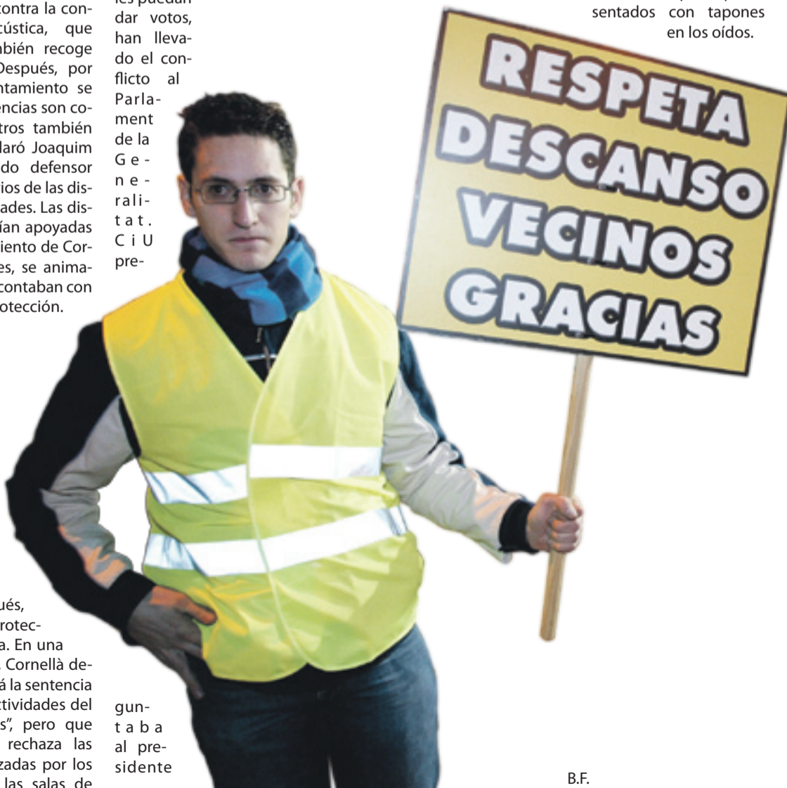
gun- t a b a al pre- sidente

Dejando de lado cualquier reflexión, si el bienestar de los vecinos del barrio Centre de L'Hospitalet depende de los acuerdos entre ayuntamientos, entonces, que esperen sentados con tapones en los oídos.