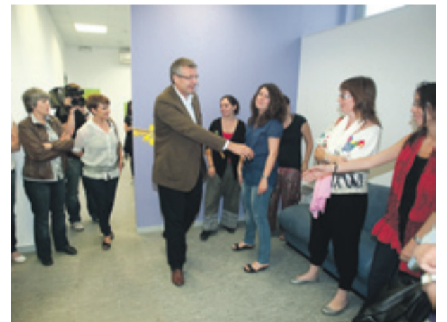
I nauguración del centro de Recursos para la Familia en Gavà