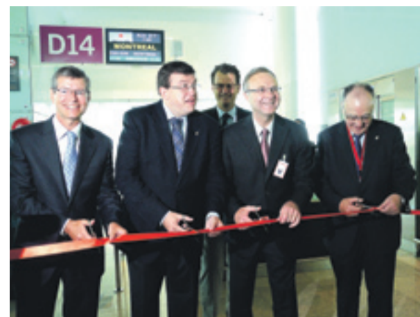
Air Canada presenta sus nuevas rutas desde el aeropuerto de Barcelona.

Citilab - Cornellà de Llobregat. CORNELLÀ | 03-06-2010