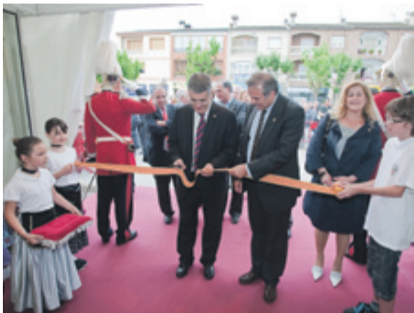
I nauguración de la Feria Comercial e Industrial de Sant Andreu de la Barca del 28 al 30 de Mayo.