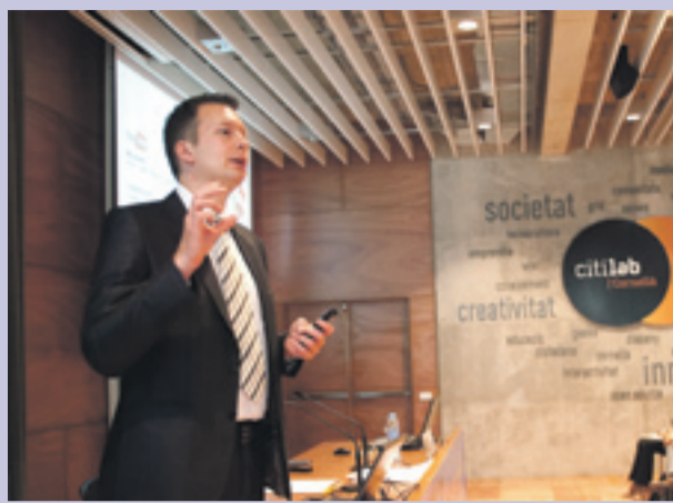
Fórum Empresarial sobre el uso de las redes sociales en las empresas.

Citilab - Cornellà de Llobregat. CORNELLÀ | 03-06-2010