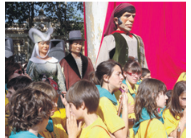
E ncuentro de Colles Geganteres en el 25 aniversario dels Gegants de Sant Feliu.