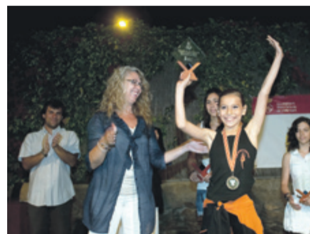
Entrega de premios de la 9ª fiesta del deporte en la Piscina de l'Escorxador, en Sant Feliu de Llobregat.