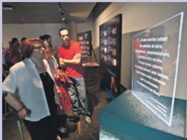
I nauguración en Gavà de una exposición sobre la fosa común de Gurb.

Biblioteca Josep Soler i Vidal. GAVÀ | 03-06-2010