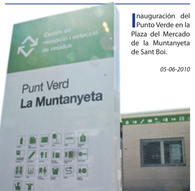
I nauguración del Punto Verde en la Plaza del Mercado de la Muntanyeta de Sant Boi.

Biblioteca Josep Soler i Vidal. GAVÀ | 03-06-2010