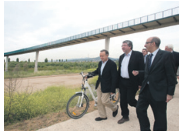
V isita de polítics locals a las actuaciones de recuperación ambiental, paisajística y social de diversos espacios fluviales del río Llobregat, con el Conseller Francesc Baltasar.