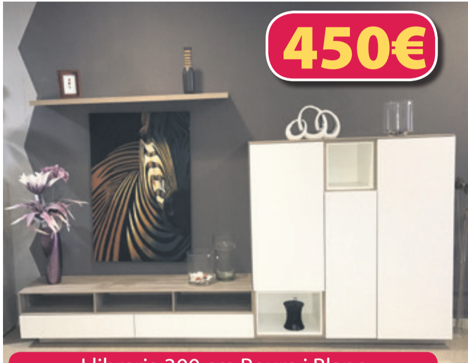
Llibreria 300 cm Roure i Blanc

Nuevas colecciones y zona outlet en: www.mueblesabitareviladecans.com