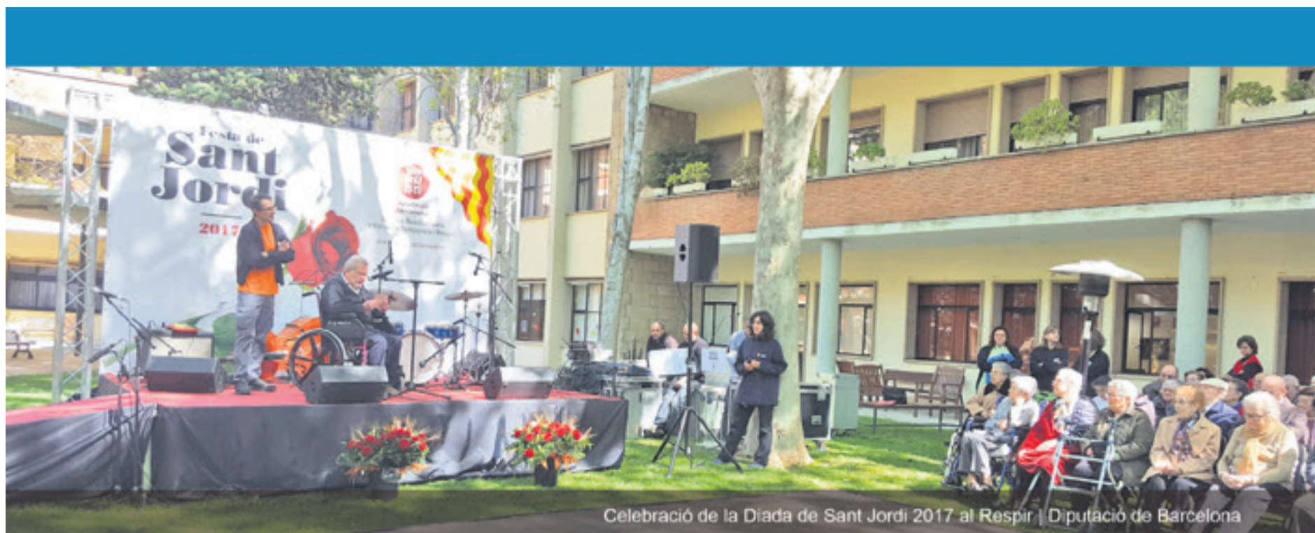
Celebració de la Diada de Sant Jordi 2017 al Respir | Diputació de Barcelona