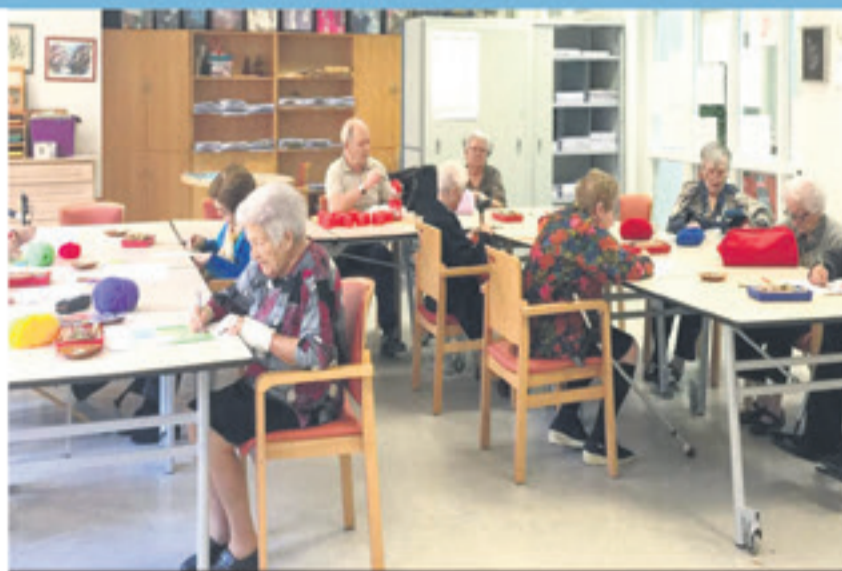
Usuaris del Respir a les instal·lacions del Recinte Mundet de Barcelona