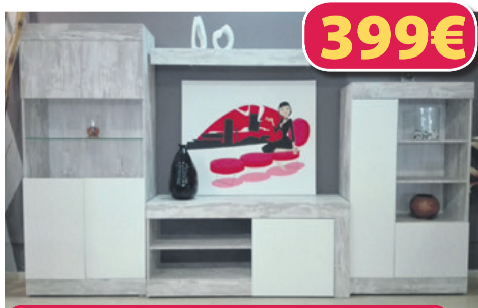
Llibreria 295 cm Vintage i Blanc