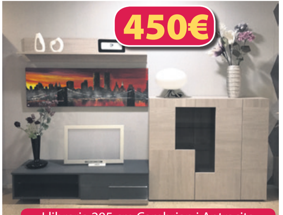
Llibreria 285 cm Cambrian i Antracita