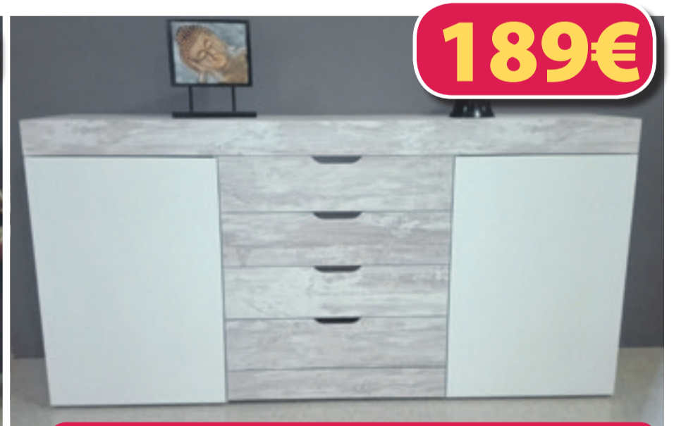
Aparador 180 cm Vintage i Blanc

Precios inmejorables en mobiliario, auxiliar y descanso.