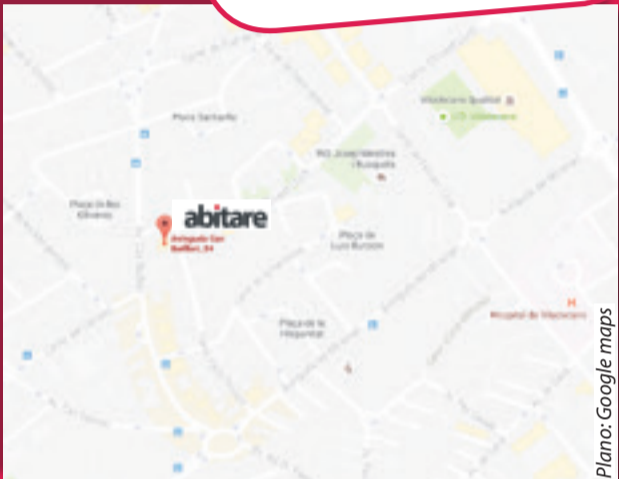
Plano: Google maps

Comedores y muebles auxiliares con líneas exclusivas. Proyectos a medida