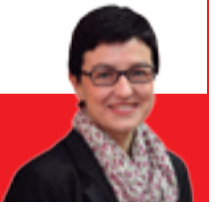
Eva Granados Diputada del PSC