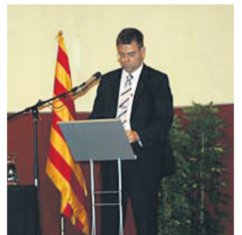
Pablo Barranco (Vox)

A finals de maig hi haurà un nou Parlament europeu. Del 22 fins al pròxim 25 de maig se celebraran a tota la Unió Europea eleccions per escollir els representants que dirigiran els destins del vell continent en els pròxims anys. El Baix Llobregat, amb un gran pes demogràfic, serà una de les comarques catalanes decisives per l'elecció dels candidats que presenten les diferents forces polítiques en unes eleccions convocades per al 25 de maig.