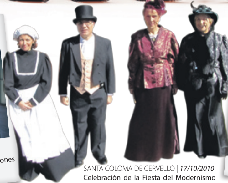
SANTA COLOMA DE CERVELLÓ | 17/10/2010 Celebración de la Fiesta del Modernismo en la Colonia Güell.