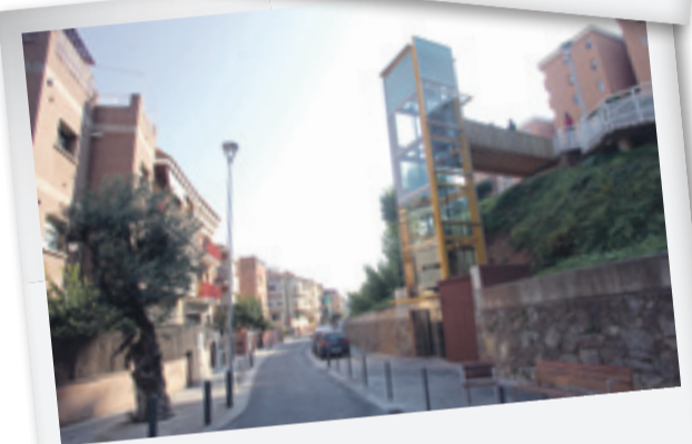
GAVÀ | 06/11/2010 Gavà pone en marcha un nuevo ascensor panorámico en el barrio "Can Tintorer".