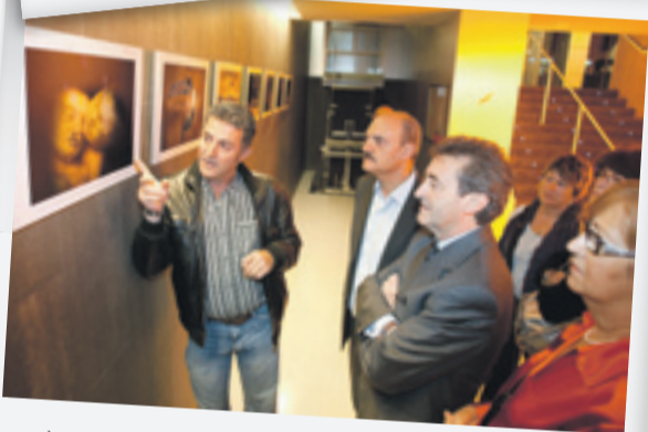
GAVÀ | 22/10/2010 "Crónicas del Edén" exposición fotográfica de Paco Feria acerca del medioambiente y la naturaleza en el Espai Maragall.