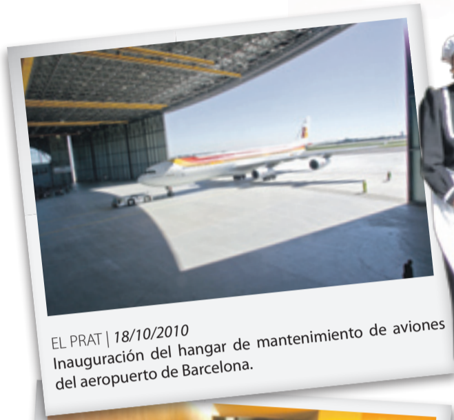
EL PRAT | 18/10/2010 Inauguración del hangar de mantenimiento de aviones del aeropuerto de Barcelona.