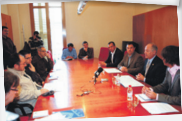
SANT BOI | 04/11/2010 Presentación en rueda de prensa del I Congreso Europeo de Proximidad en el ayuntamiento de Sant Boi.