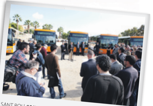
SANT BOI | 05/11/2010 Inauguración de la nueva línea de autobuses L79 en la Plaza de la Agricultura de Sant Boi.