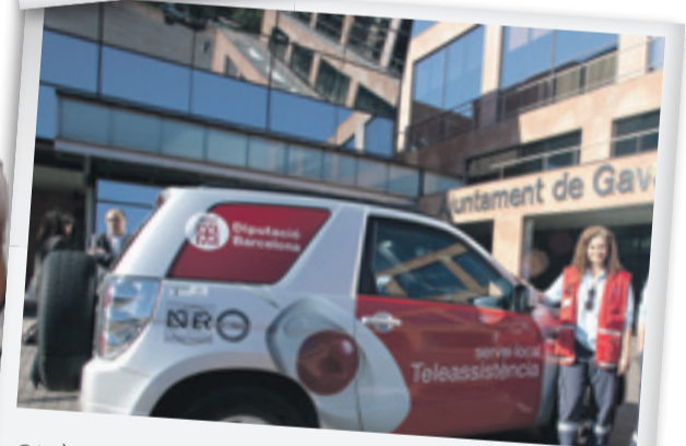
GAVÀ | 12/11/2010 Presentación en Gavà de la unidad móvil del servicio de teleasistencia.

Paco Feria ha actualizado su banco de imágenes / agencia gráfica Travel Reportages con nuevas imágenes de Portugal. Travel Reportages comercializa todo el trabajo del fotoperiodista Paco Feria alrededor del mundo, desde el reciente trabajo en Portugal hasta los reportajes en Africa, Israel, Jordania, Camboya, Vietnam, etc, etc. Un amplio resumen con enlaces y pase de diapositivas está disponible en la portada de Travel Reportages: