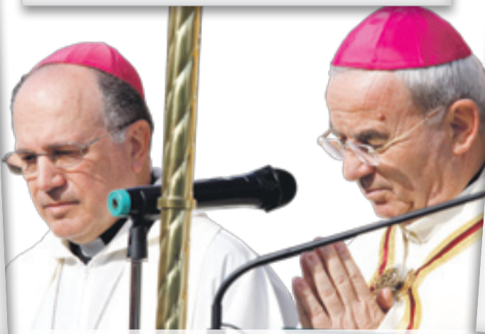
SANT FELIU | 23/10/2010 Inauguración de la nueva sede del Obispado de Sant Feliu de Llobregat en la calle Armenteres,35.