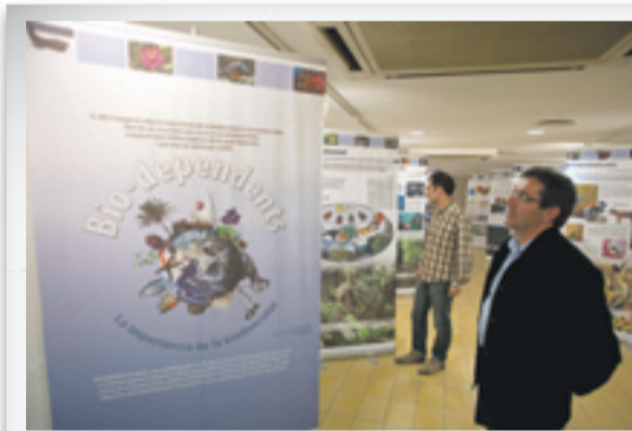
GAVÀ | 08/11/2010 Inauguración de la exposición "Biodiversitat" en el Casal Sant Jordi de Gavà.