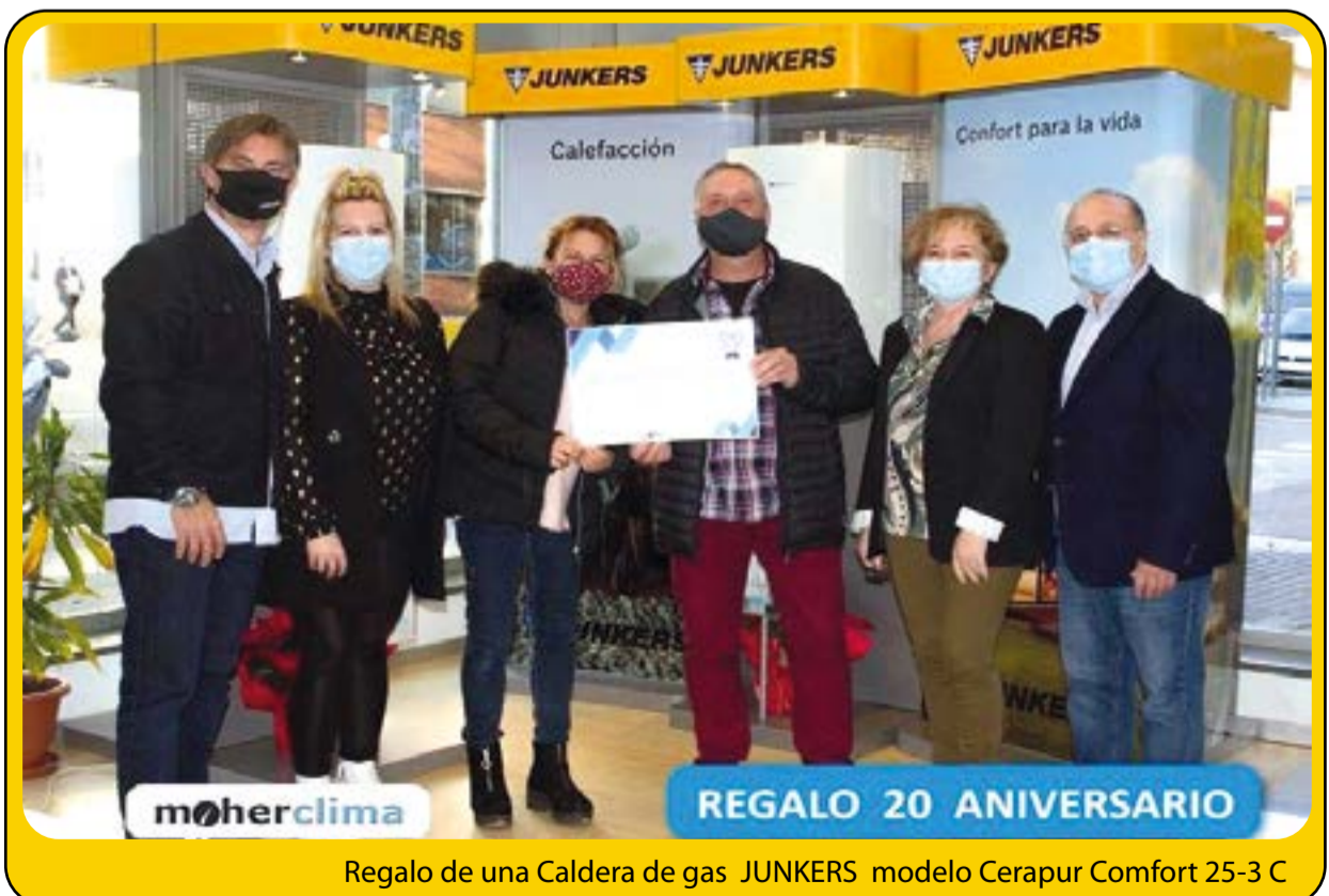
Regalo de una Caldera de gas JUNKERS modelo Cerapur Comfort 25-3 C

Nuestra principal publicidad la hacen nuestros clientes: más del 80% de las instalaciones que realizamos es gracias al boca a boca.